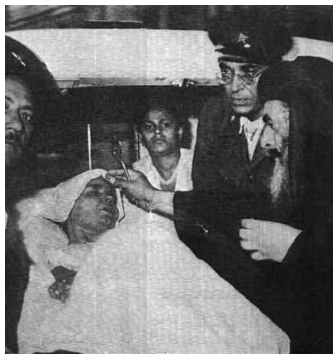
A sick woman brought to the Pope Kyrillos VI's residence in an ambulance. She was cured after being anointed with oil by His Holiness.